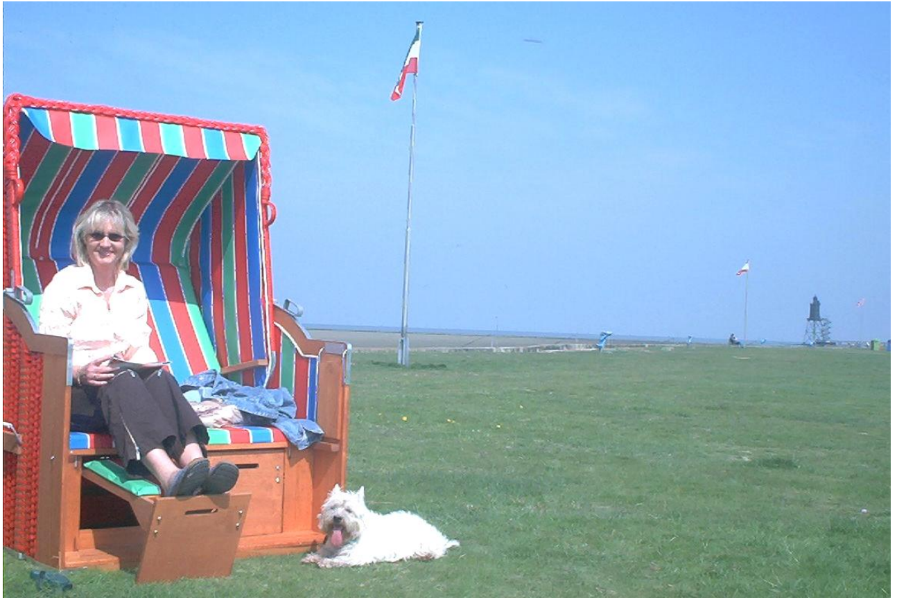
Der Grünstrand in Dorum Neufeld mit Blick auf die Nordsee